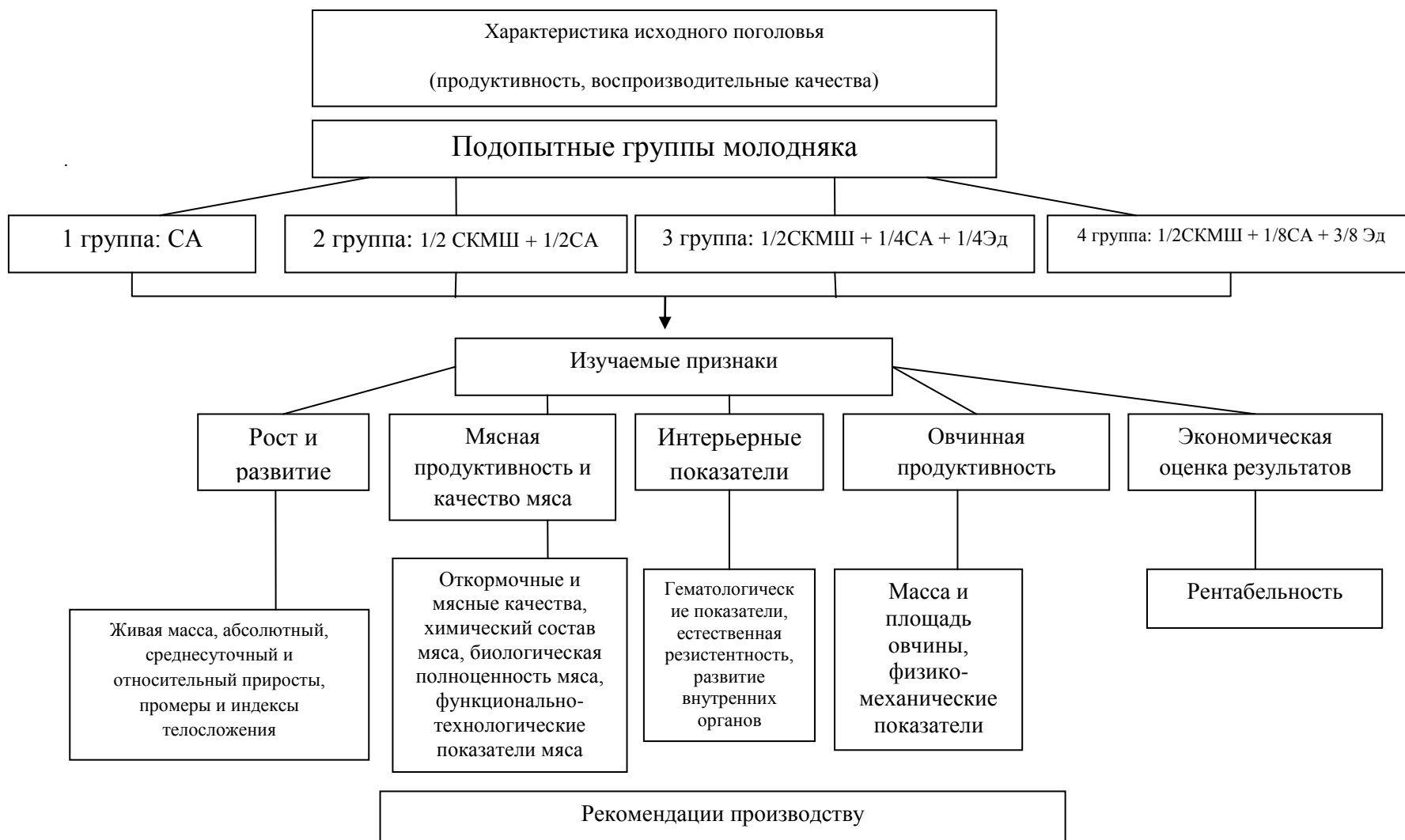
Рис. 1. Схема исследований